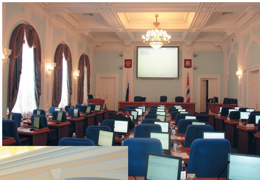
Зал заседаний Законодательного Собрания области