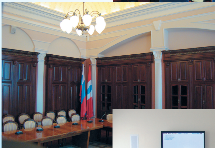
Зал заседаний КОМИТЕТОВ