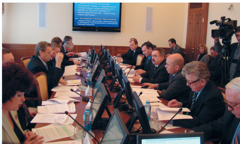
Заседание «круглого стола». 12 февраля 2009 года

центр технической инвентаризации и землеустройства», депутаты и представители исполнительной власти муниципальных районов Омской области. Всего в семинаре-совещании приняли участие более 80 человек.