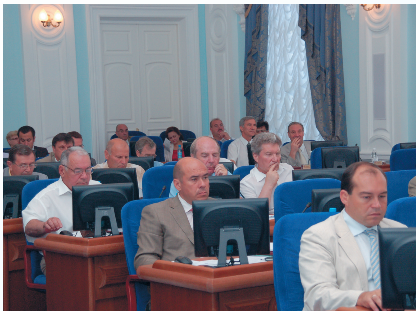
Заседание Законодательного Собрания Омской области

Законодательное Собрание Омской области в процессе законотворчества взаимодействует с Губернатором и Правительством Омской области.