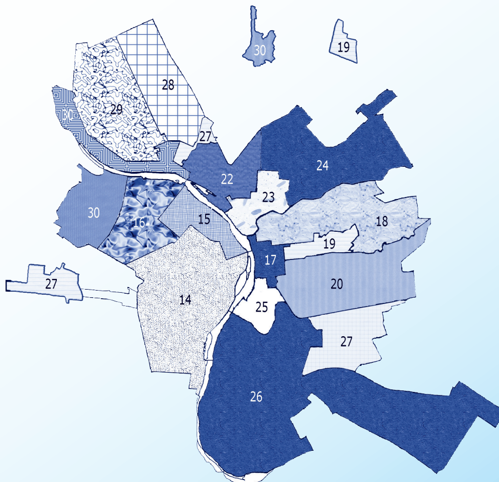
Схема избирательных округов по выборам депутатов Законодательного Собрания Омской области 24 марта 2002 года (город Омск)