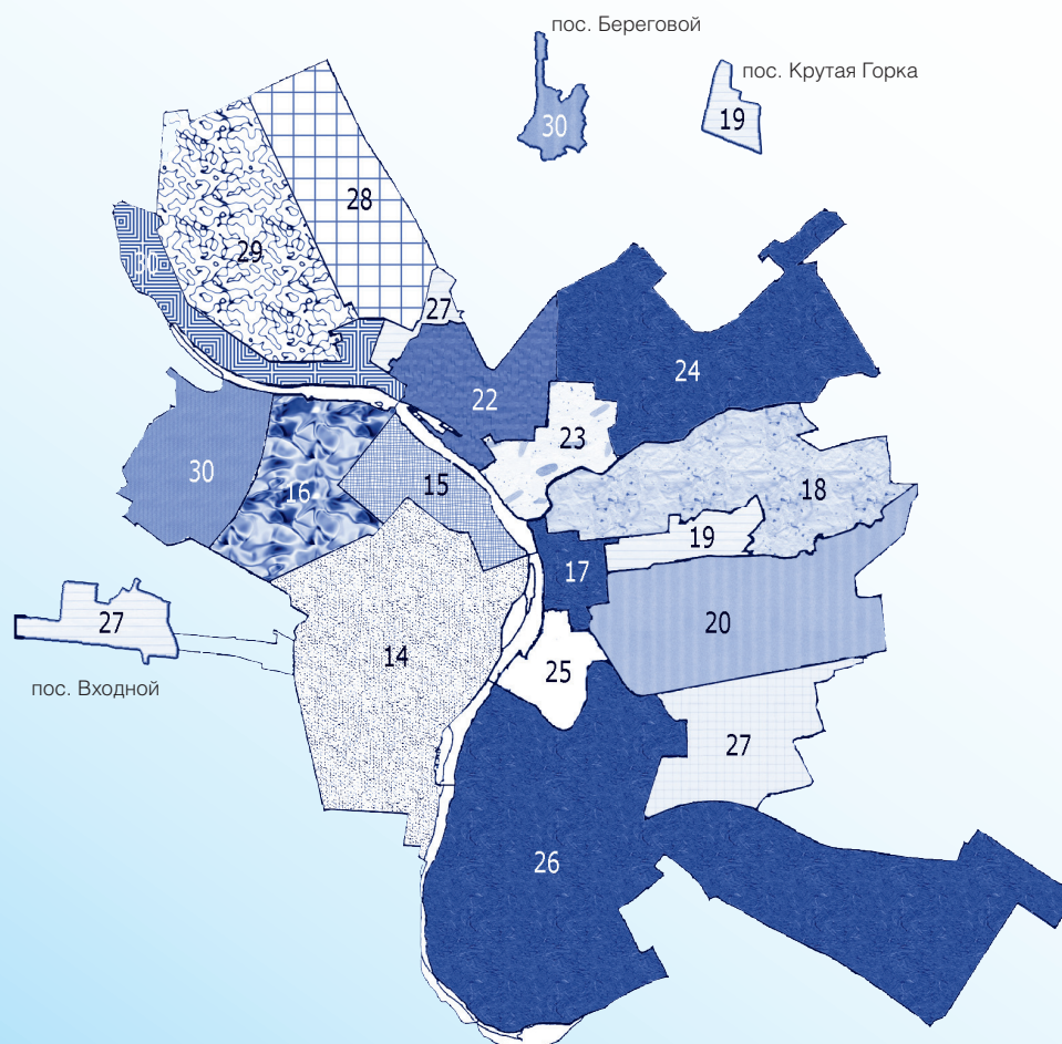
Схема избирательных округов по выборам депутатов Законодательного Собрания Омской области 20 марта 1994 года (город Омск)