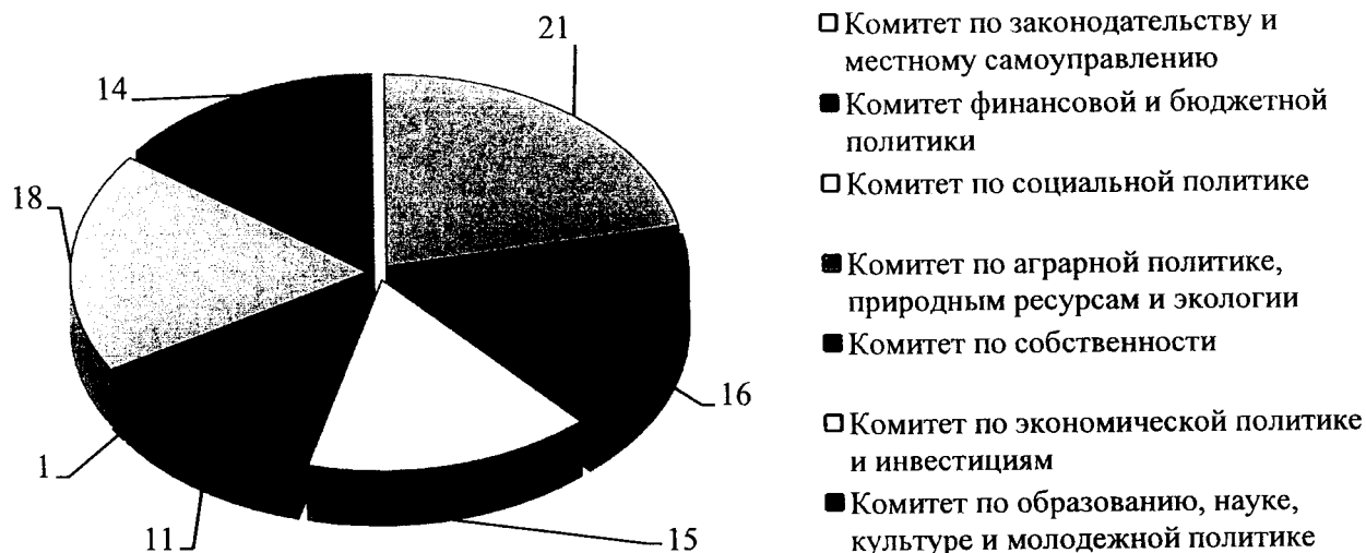
Диаграмма 2. Распределение проектов законов Омской области, принятых Законодательным Собранием Омской области в 2018 году, по направлениям деятельности комитетов Законодательного Собрания Омской области

Распределение законов Омской области, принятых Законодательным Собранием Омской области в 2018 году, по направлениям деятельности комитетов Законодательного Собрания Омской области приведено на диаграмме 2.