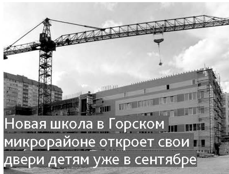
Новая школа в Горском микрорайоне откроет свои двери детям уже в сентябре

Агитационные материалы опубликованы безвозмездно. Размещены Всероссийской политической партией «ЕДИНАЯ РОССИЯ»