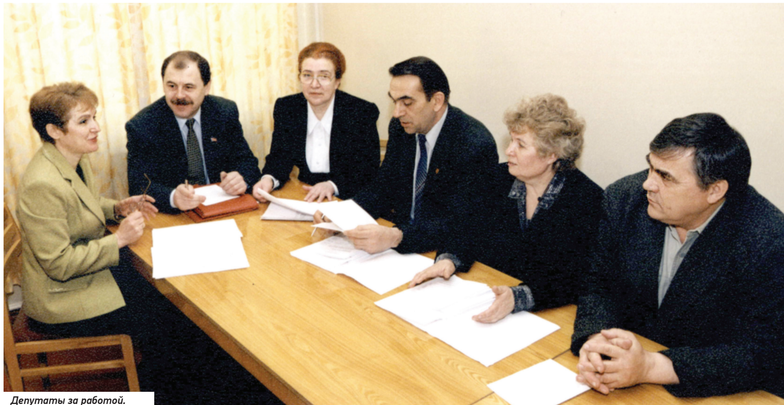
Депутаты за работой.

Одним из направлений деятельности комитета по собственности стало проведение «круглых столов» по актуальным проблемам. Наиболее продуктивные дискуссии состоялись по темам «Регулирование земельных отношений в Омской области», «Учет и управление государственной собственностью» и «О практике реализации закона «О разграничении имущества, находящегося в муниципальной собственности, между Марьяновским муниципальным районом и входящими в его состав поселениями Омской области». На таких встречах обозначались насущные проблемы, связанные с правовым регулированием имущественных и земельных отношений, решение которых возможно только на федеральном уровне. По итогам «круглых столов» разрабатывались и продолжают готовиться проекты федеральных законов.