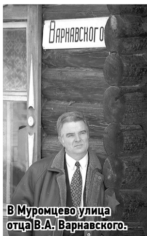
В Муромцево улица отца В.А. Варнавского.