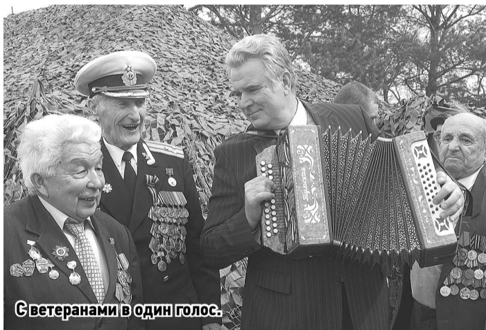
С ветеранами в один голос.