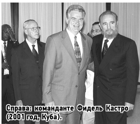
Справа: команданте Фидель Кастро (2001 год, Куба).