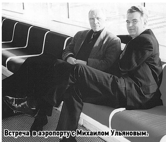
Встреча в аэропорту с Михаилом Ульяновым.