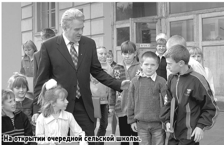
На открытии очередной сельской школы.