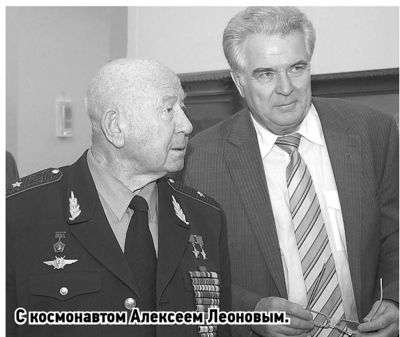
С космонавтом Алексеем Леоновым.