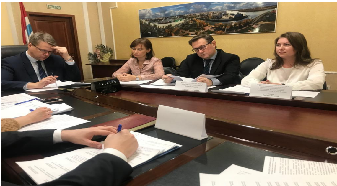
Участие в работе Общественного совета при прокуратуре Омской области по защите прав юридических лиц и индивидуальных предпринимателей (16 декабря 2019 года)

- Экспертная группа АСИ (Агентство стратегических инициатив по продвижению новых проектов) по мониторингу и контролю за внедрением целевых моделей упрощения процедур ведения бизнеса и повышения инвестиционной привлекательности в Омской области;