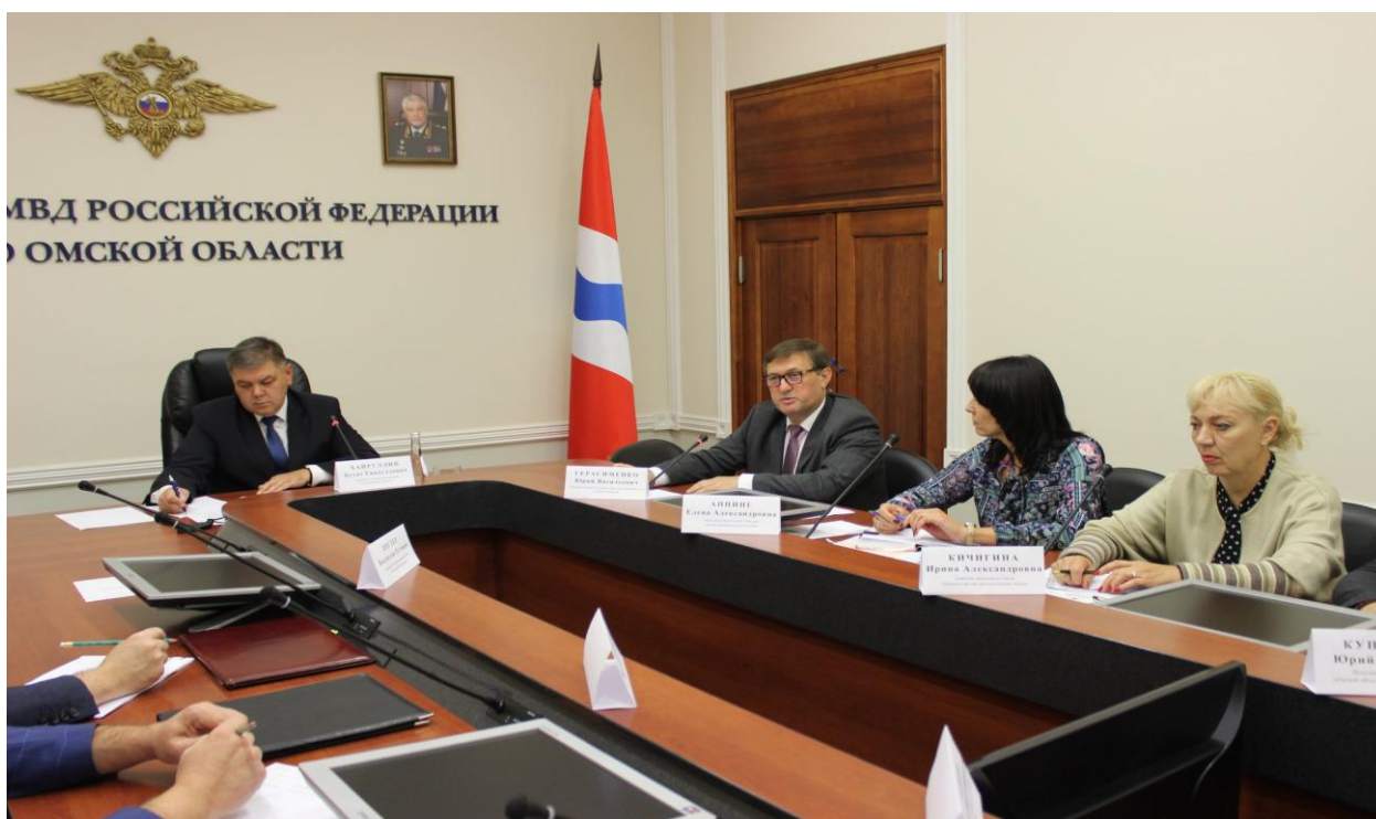
Выступление на совещании в УВД по Омской области (6 сентября 2019 года)

- Соглашение о взаимодействии Управления Министерства внутренних дел Российской Федерации по Омской области и Уполномоченного по защите прав предпринимателей в Омской области;