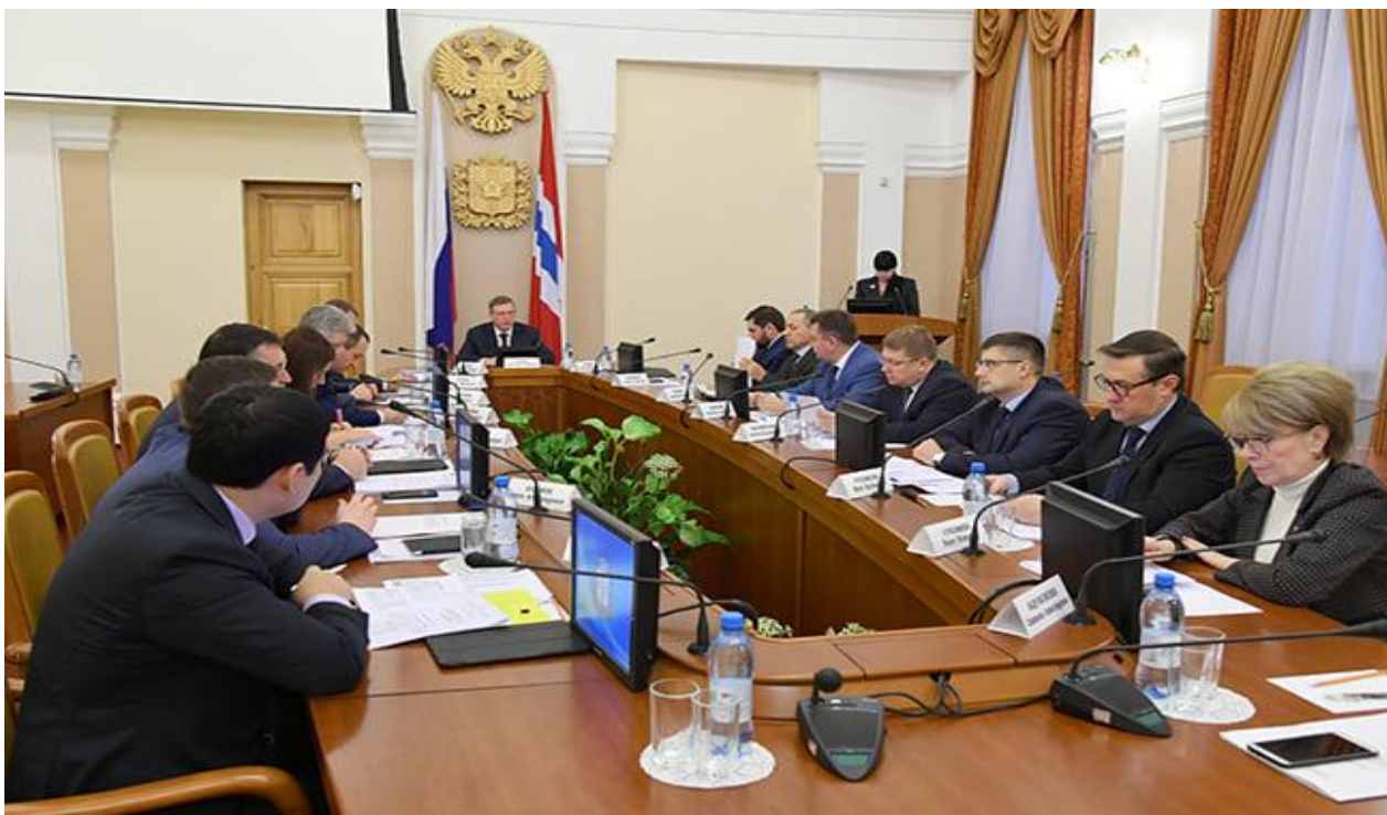
Заседание Комиссии по координации работы по противодействию коррупции в Омской области (25 сентября 2019 года)