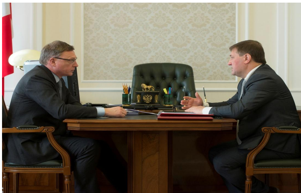
Представление ежегодного Доклада Губернатору Омской области

В срок до 1 марта очередного года Уполномоченный представляет Законодательному Собранию Омской области и Губернатору Омской области доклад о соблюдении прав и законных интересов субъектов предпринимательской деятельности на территории Омской области, включающий, в том числе, информацию об оценке условий осуществления предпринимательской деятельности в Омской области, а также предложения о совершенствовании правового положения субъектов предпринимательской деятельности. Согласно Регламенту Законодательного Собрания Омской области доклад рассматривается комитетом по экономической политике и инвестициям.