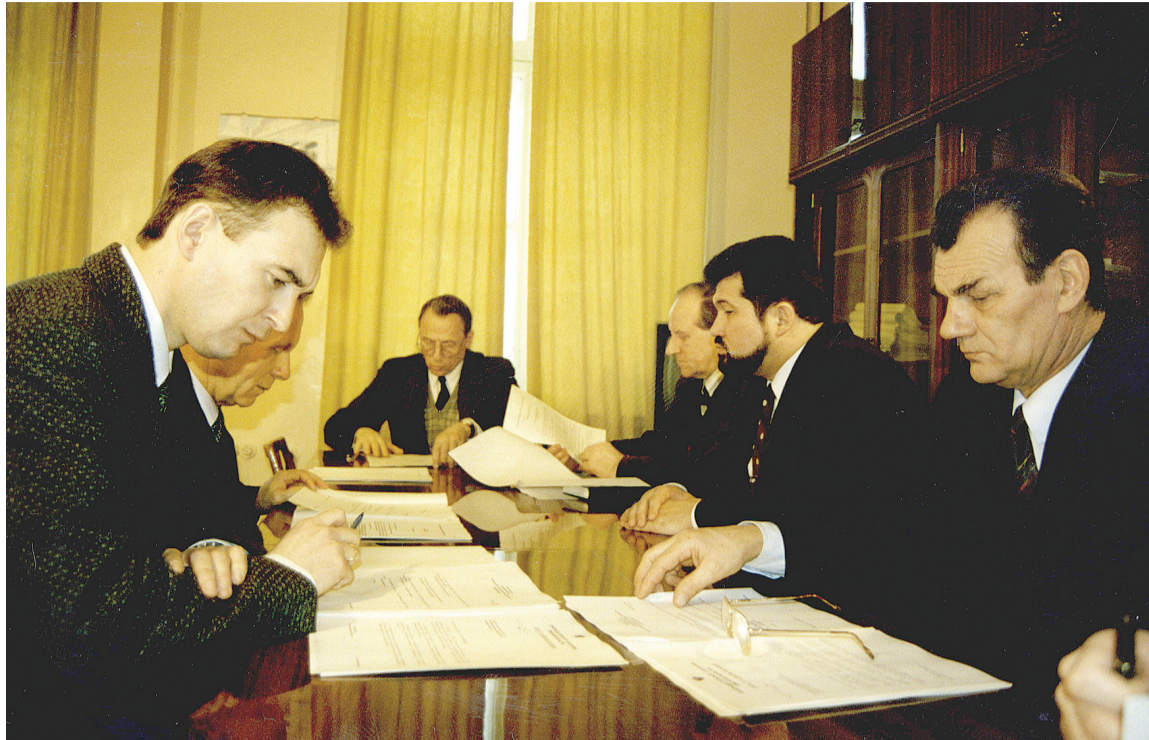
Депутаты первого созыва Заксобрания Омской области в условиях жесткого кризиса 90-х думали о развитии области и принимали законы с расчетом на перспективу.

Подводя итог работы за прошедшие двадцать пять лет, могу сказать, что Законодательное собрание как законодательный, представительный орган власти субъекта Федерации состоялось. Законодательное собрание профессионально выполняет обязанности, возложенные на него Конституцией. Обеспечен баланс властей, направленный на защиту интересов граждан. Конструктивная совместная работа законодательной и исполнительной ветвей власти направлена на решение экономических проблем, повышения инвестиционной привлекательности региона. А значит — на улучшение благосостояния омичей.