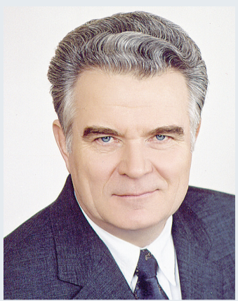
Владимир ВАРНАВСКИЙ, председатель Законодательного собрания Омской области:

— Сегодня мы подводим итоги двадцатипятилетней деятельности Законодательного собрания Омской области. Это особенный период. Если посмотреть на историю создания и работы представительных органов власти, это было тяжелое время. Законодательное собрание рождалось фактически на пустом месте. До этого были Советы, которые принимали решения, а здесь формировался совершенно другой орган власти. Менялся сам механизм государственного устройства, менялись правовые акты. Нужно было определить, что такое Законодательное собрание, кто такой глава администрации области, а затем и губернатор. Не было закона о выборах, не было ничего. А за двадцать пять лет работы принято более двух тысяч ста сорока законов Омской области, депутатами избирался сто пятьдесят один человек. Безусловно, все эти законы рождались при поддержке избирателей, общественных организаций, партий, местного самоуправления, органов федеральной власти и региональной исполнительной власти.