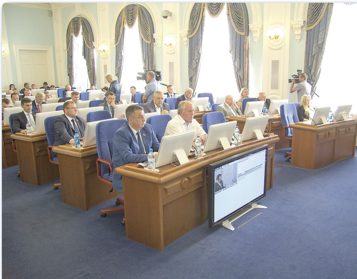
В Законодательное собрание Омской области шестого созыва избрано 44 депутата.