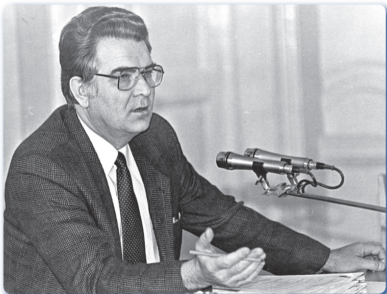
Бессменный председатель Законодательного собрания Омской области Владимир Варнавский.