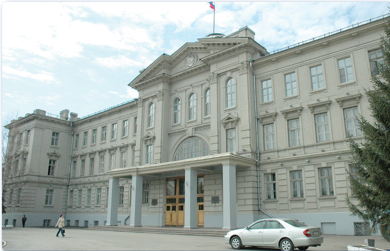
За двадцать пять лет работы высшего законодательного (представительного) органа государственной власти Омской области в его состав был избран 151 депутат.