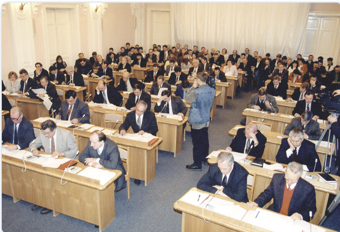
Депутаты первого созыва на заседании Законодательного собрания.