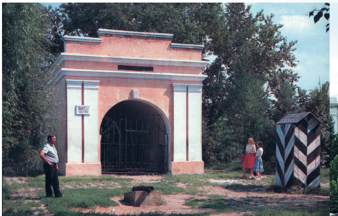
Тобольские ворота омской крепости

Возведенная в 1716 году по указу Петра I Омская крепость являлась стратегически важным военно-административным центром Сибири. В 1782 году Омская крепость была преобразована в город в составе Тобольского наместничества. Из южной части Тарского уезда был образован Омский уезд. Наряду с исключительно военными задачами Омск все больше начинает выполнять торговые функции, медленно превращается в центр крупного земледельческого района. В 1822 году Сибирь была разделена на два генерал-губернаторства – Западно-Сибирское и Восточно-Сибирское. В 1823 году была образована Омская область, но выполнив свои задачи, в 1838 году она упраздняется. С 1839 года город Омск официально становится центром Западно-Сибирского генерал-губернаторства, границы которого простирались от берегов Северного Ледовитого океана на севере до города Верного (Алма-Ата) на юге.