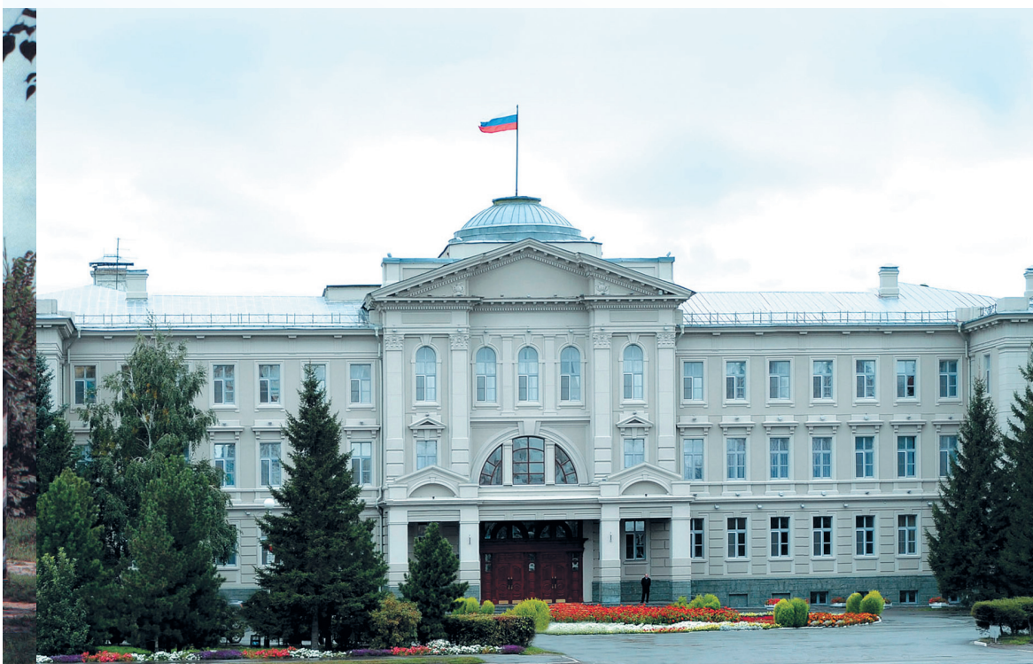
Законодательное Собрание Омской области

В 1854 году Омск стал центром специально созданной Области сибирских киргизов, которая в 1868 году была преобразована в Акмолинскую область. До начала 80-х годов XIX века в Омске располагалось также Главное управление Западной Сибири, а после его упразднения город стал центром Степного генерал-губернаторства.