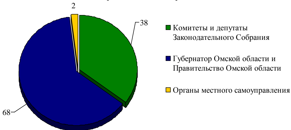
Диаграмма 1. Распределение проектов законов Омской области, внесенных на рассмотрение Законодательного Собрания в 2016 году, по субъектам права законодательной инициативы

Распределение проектов законов Омской области, внесенных на рассмотрение Законодательного Собрания в 2016 году, по субъектам права законодательной инициативы приведено на диаграмме 1.