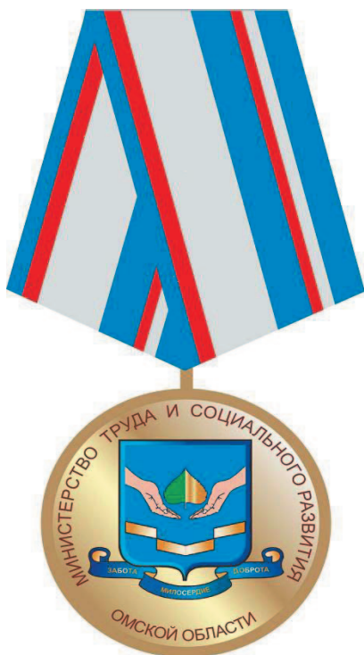
РИСУНОК медали Министерства труда и социального развития Омской области "За заслуги в области социальной защиты и социально-трудовых отношений"

Приложение № 4 к приказу Министерства труда и социального развития Омской области от 15 декабря 2011 г. № 85-п