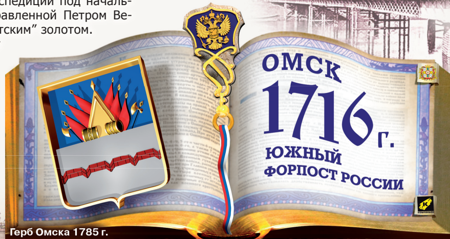
Герб Омска 1785 г.

В крепость вело несколько ворот, в ее центре, на площади, стояла деревянная церковь во имя Сергия Радонежского. Вокруг церкви располагались казенные постройки. Гарнизон крепости в 30-х гг. XVIII в. состоял из 150 казаков и 200 солдат, а в 1742 году населения при ней насчитывалось 1092 человека.