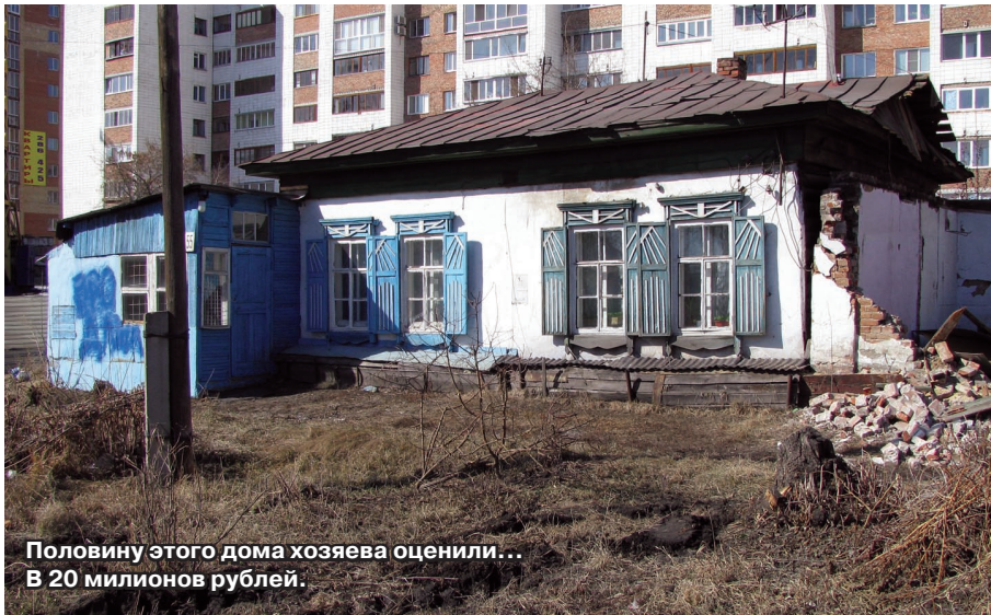
Половину этого дома хозяева оценили... В 20 миллионов рублей.

Кто будет жить в этих домах? Льготники, стоящие десятками лет в очередях? Хозяева снесенных частных построек? Или же состоятельные граждане, вкладывающие лишние деньги в элитную недвижимость? Кстати, в новом законодательстве, нет понятия «ветхого» жилья, есть лишь «аварийное». И планы его сноса