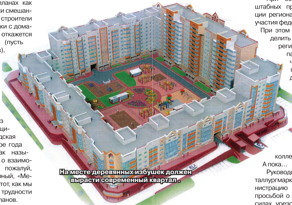
На месте деревянных избушек должен вырасти современный квартал.