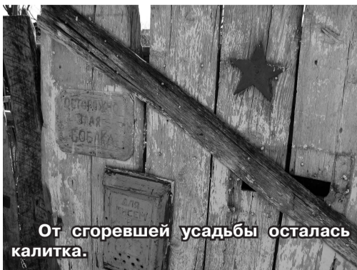
От сгоревшей усадьбы осталась калитка.

Почитаем еще отрывки из Лениного сочинения: