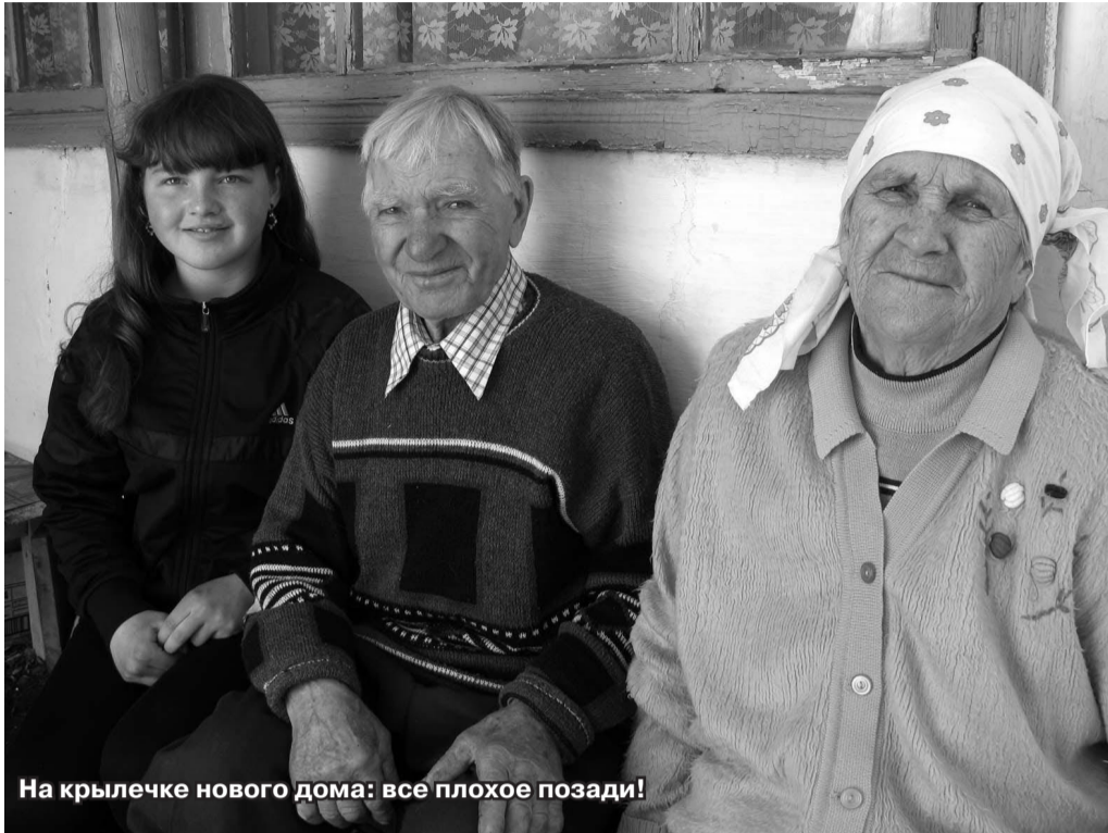
На крыльце нового дома: все плохое позади!