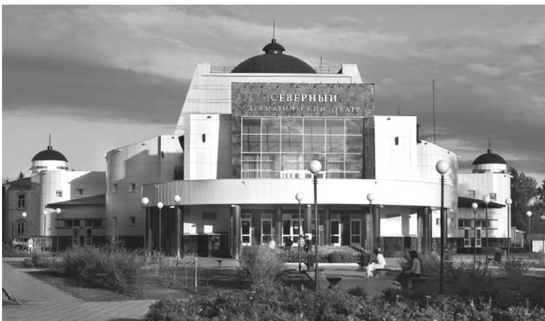
✓ В Таре открылись новые здания Северного драматического театра и Центральной районной библиотеки