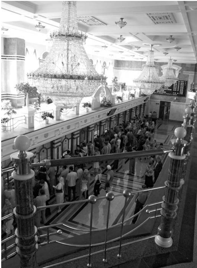
✓ Завершена реконструкция Железнодорожного вокзала