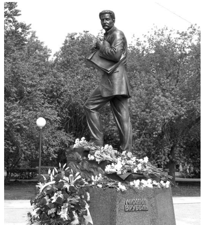
✓ Открыт памятник Михаилу Врубелю