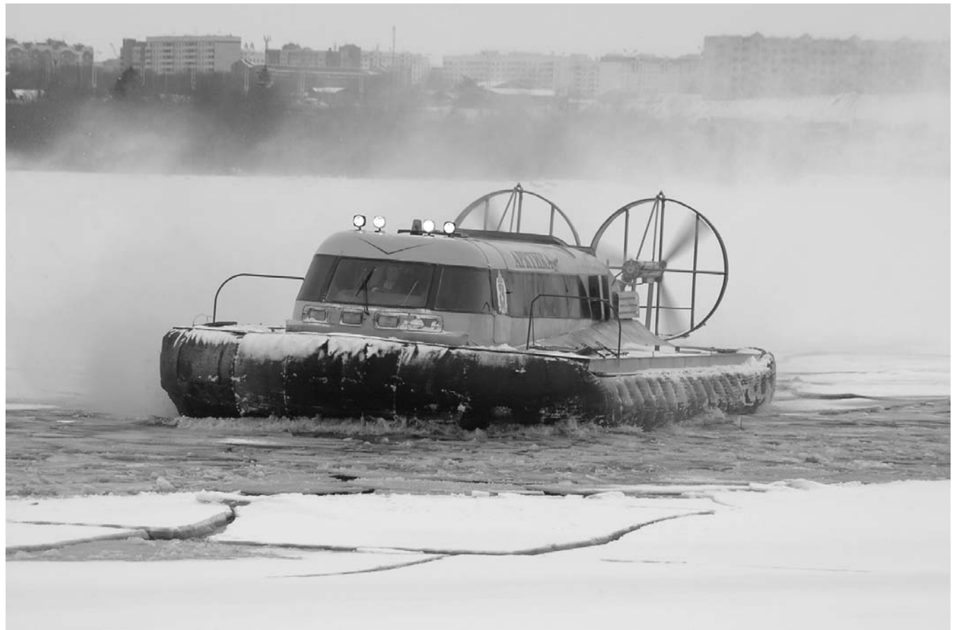
✓ Завершены испытания вездехода «Арктика» третьего поколения