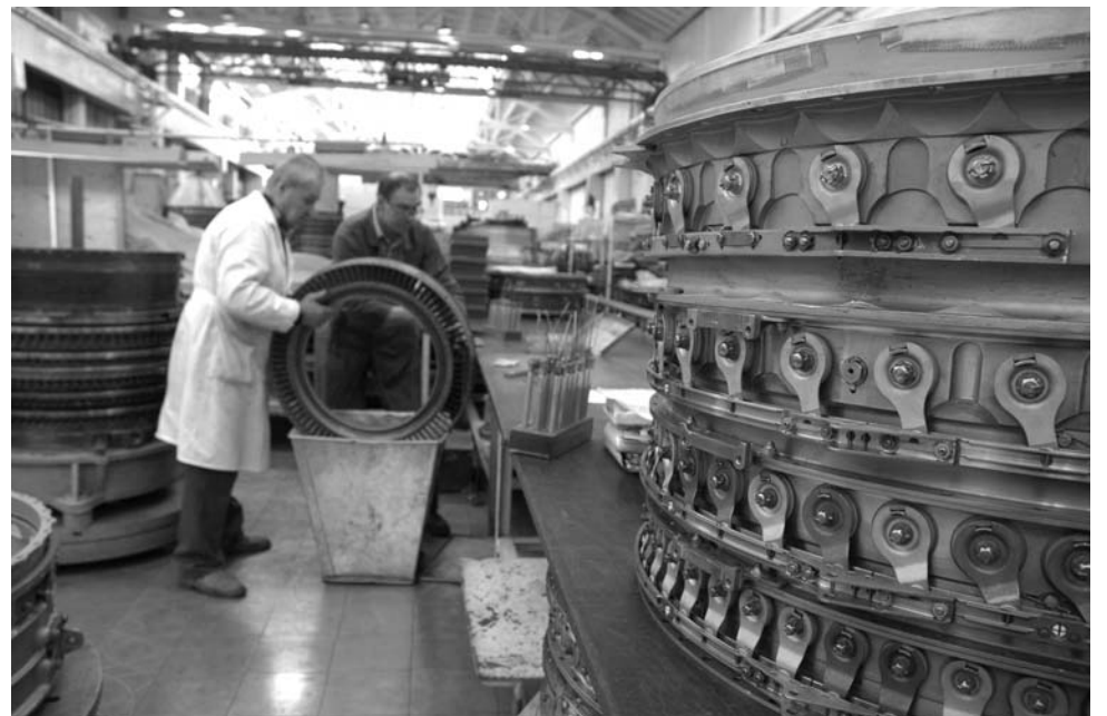
✓ ПО «Полет» и МПО им. Баранова вошли в федеральные холдинги