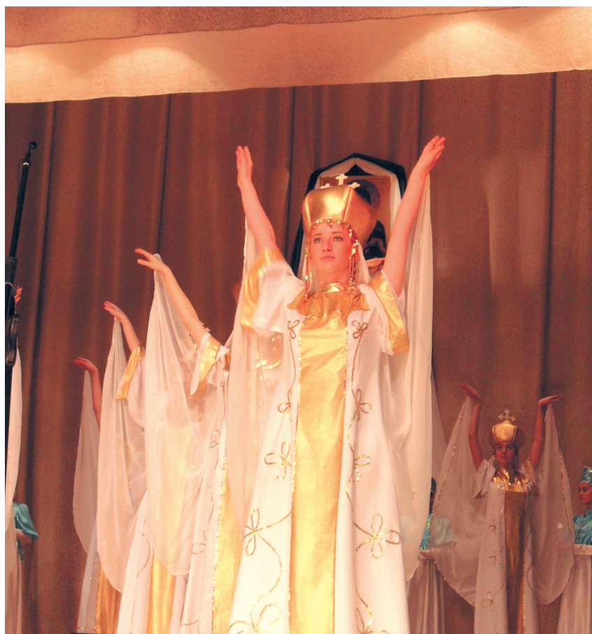
ОБРАЗЦОВЫЙ ФОЛЬКЛОРНЫЙ АНСАМБЛЬ «СОЛНЫШКО».

Со сцены ДК им. Гуртьева (ныне это 9-й корпус ОмГУ), где, собственно, и шел концерт, прозвучало 26 совершенно разных колядок. Это почти вдвое больше, чем в прошлом году. В два раза увеличилось и число участников. В этот раз выступило 13 коллективов. Самый молодой из них появился в октябре прошлого года. Это церковный хор Успенского кафедрального собора. Коллектив сформирован из студентов и выпускников факультета культуры и искусств ОмГУ и консерваторий. В начале января